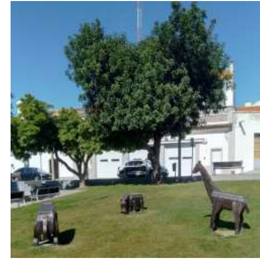
Animais de Madeira

Do trabalho em equipa vais precisar, para chegar ao fim sem estragar