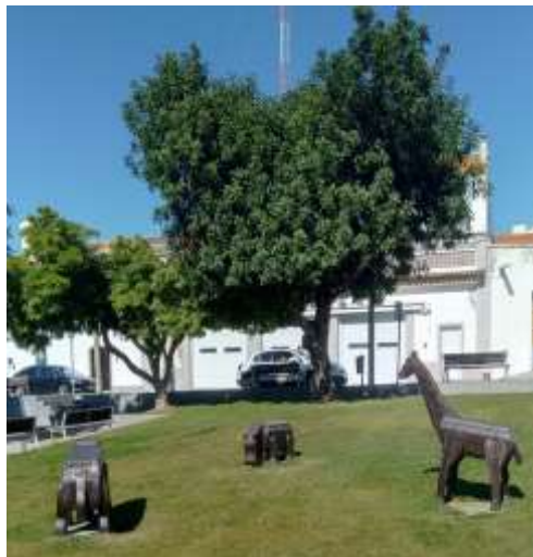
Animais de Madeira

Do trabalho em equipa vais precisar, para chegar ao fim sem estragar