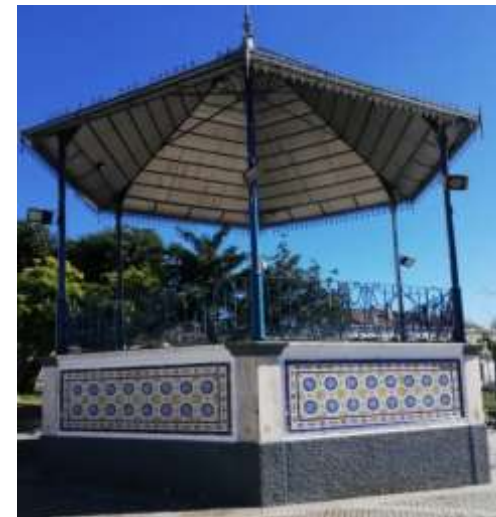
Posto do Coreto

Em forma tens de estar, para a sorte te ajudar