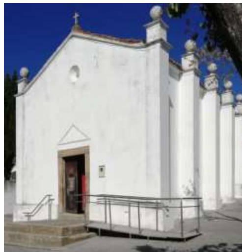
Capela dos Remédios

Afina a pontaria pois vais precisar, porque nos açúcares tens de acertar