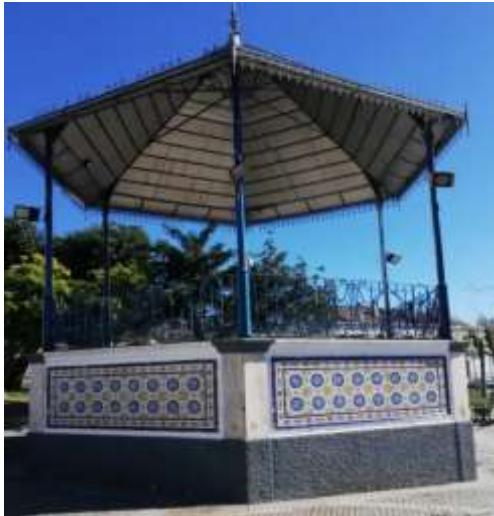
Posto do Coreto

Afina a pontaria pois vais precisar, porque nos açúcares tens de acertar