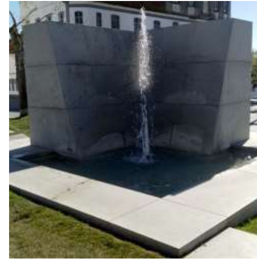
Monumento da Tapeteira

Com música a tocar, as respostas tens de acertar