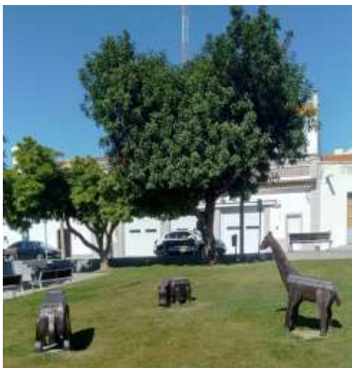
Animais de Madeira

Com música a tocar, as respostas tens de acertar