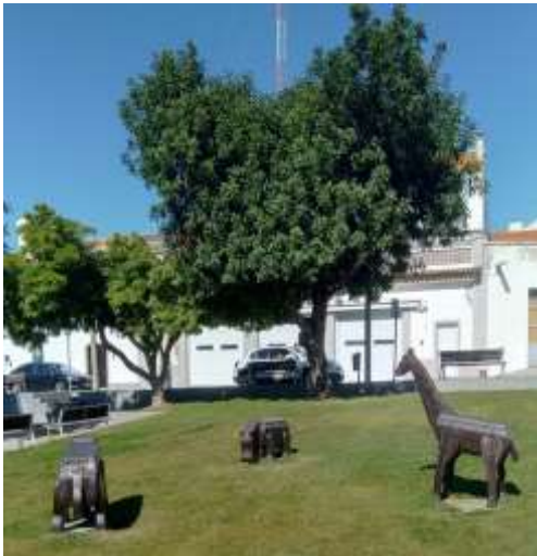
Animais de Madeira

Do trabalho em equipa vais precisar, para chegar ao fim sem estragar