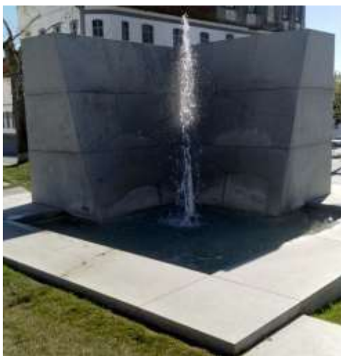
Monumento da Tapeteira

A Separação tens de fazer, para saber como comer