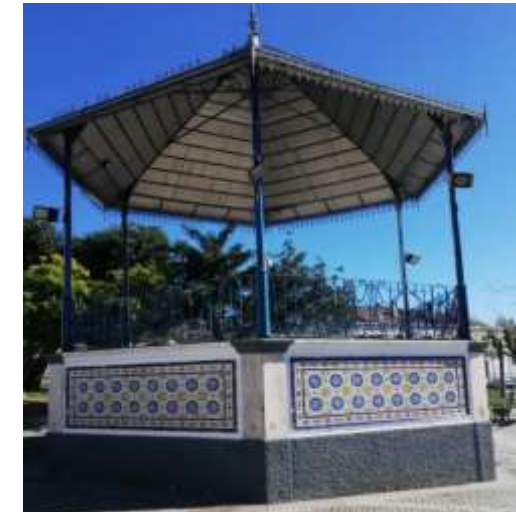
Posto do Coreto

Em forma tens de estar, para a sorte te ajudar