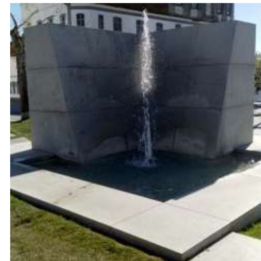
Monumento da Tapeteira

Com música a tocar, as respostas tens de acertar