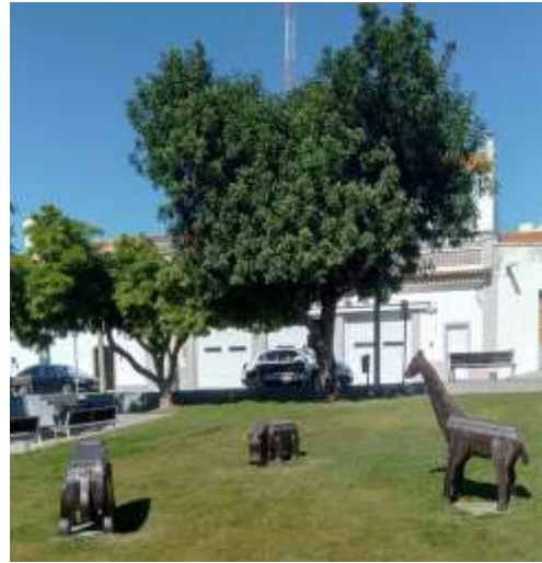
Animais de Madeira

Do trabalho em equipa vais precisar, para chegar ao fim sem estragar