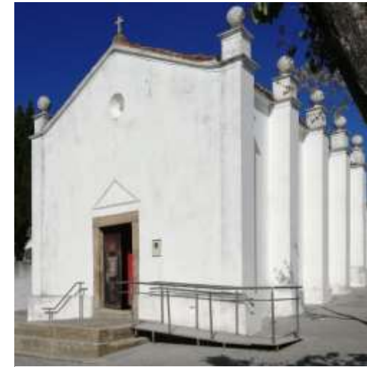
Capela dos Remédios

Afina a pontaria pois vais precisar, porque nos açúcares tens de acertar