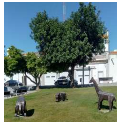
Animais de Madeira

Do trabalho em equipa vais precisar, para chegar ao fim sem estragar