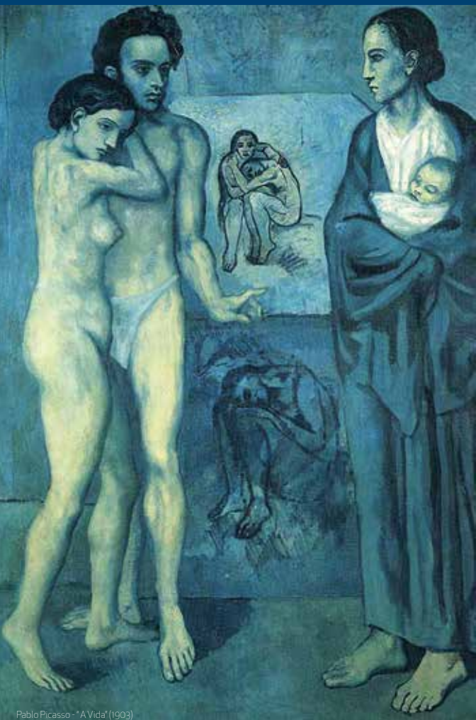
Pablo Picasso - "A Vida" (1903)